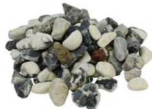
Sjösingel Svartvit 15 kg 16-32 mm. 5 cm lager, 68 kg/kvm