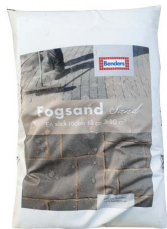
Fogsand 15 kg Distansierar varje sten/platta i markbeläggningen så att de inte ligger kloss i kloss och skaver mot varandra.