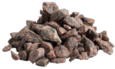
Röd Granit 20 kg 8-16 mm. 3 cm lager, 45 kg/kvm