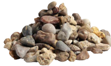
Sjösingel Gulmelerad 15 kg 8-16 mm. 3 cm lager, 45 kg/kvm