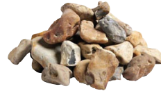
Sjösingel Gulmelerad 15 kg 16-32 mm. 5 cm lager, 68 kg/kvm