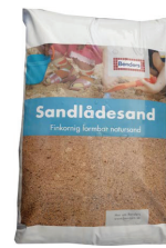
Sandladesand 15 kg Bakbar sand för sandlådan, eller utfyllnad av hål i t.ex gräsmattan.