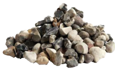
Sjösingel Svartvit 15 kg 8-16 mm. 3 cm lager, 45 kg/kvm