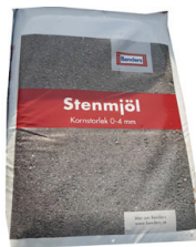
Stenmjöl grå 15 kg Ger en hård, lättkött yta som ytbeläggning på gångvägar. Används även som fogsand till marksten.