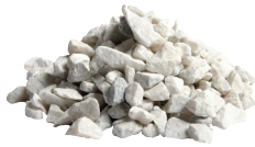
Marmorkross Vit 20 kg 8-16 mm. 3 cm lager, 45 kg/kvm