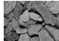
Skifferkross Grafit 15 kg 20-40 mm. 5 cm lager, 60 kg/kvm