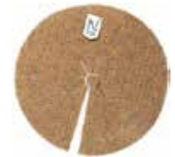
Ogrässkydd Finns i 45 cm & 60 cm Matta av kokosfiber. förhindrar ogräs & bevarar fukten.