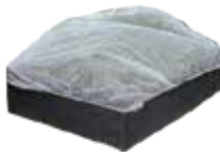
Fiberduk för pallkrage (23g) Måttanpassad för pallkrage med insydd resår. 1,4 x 1,8 m