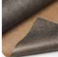
Plantex Gold (125g) Säljs i rullar 1,15 m bred 10 m lång

Säljs per lpm. Kan läggas utan ytterligare täckning. Idealisk till slänter och erosion.