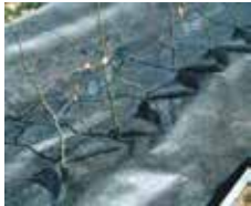
Plantex Häckduk (68g) Säljs i rullar 0,5 m bred 20 m lång. Skyddar häcken mot ogräs. Bevarar fukt & värme.