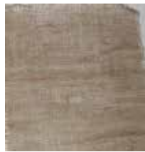
Skuggväv / Juteväv 1,2 x 3 m och 1,8 x 5,5 m Skyddar växter mot sol, kyla, vind. Även till skuggning av t.ex. växthus.