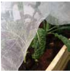
Kålnät 2 x 5 m och 4 x 5 m Ett svalare nät skyddar kål och andra grödor från insektsangrepp.