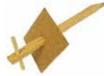
Träspik och Träbricka. För att förankra ogräsdukar.