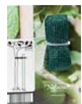
Träduppbindare 3 m Band av plastväv. Bredd 30 mm