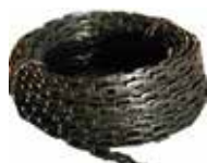
Kedjeuppbindning Säljs per meter. Robust plastkedja för trädupp- bindning. 25 mm bred.