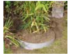
Plantex Rotspärr (325g) Sälj i rullar 0,7 m bred 3 m lång. Används till väx- ter med aggressiva rötter.