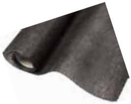
Plantex Ogräsduk 2 m bred (68g)

Säljs per lpm. Luft, vatten & näring tränger igenom, men hindrar ogräset.