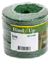
Jutesnöre Grönt Finns i 60 m och 200 m