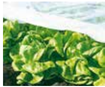
Fiberduk (17g) 2 x 20 m och 2,4 x 6,5 m. Skyddar växter mot vind, stark sol & flygande insekter.