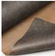
Plantex Gold 2 m bred (125g)

Säljs per lpm. Luft, vatten & näring tränger igenom, men hindrar ogräset.