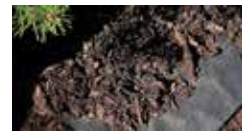
Barkduk (50g) 1 x 10 m och 1 x 15 m. Håller ogräset borta. Släp- per genom luft & vatten.