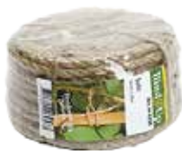
Juterep 15 m 3-trådigt, 6 mm juterep.