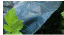
Marktäckväv (105g) 2 x 5 m. Svälter ut besvärliga rotogräs, t.ex. kirskaål och kvickrot.